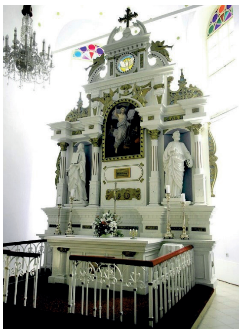
Schlesische Evangelische Kirche A. B. in Orlová/Orlau, CZ

VEREIN FÜR SCHLESISCHE KIRCHENGESCHICHTE Geschäftsstelle Langenstr. 43, 02826 Görlitz Tel.: 03581/876682 (Frau Kempgen) oder 03581/876681 (Frau Kunick) E-Mail: kirchengeschichte@evangelisches-schlesien.de